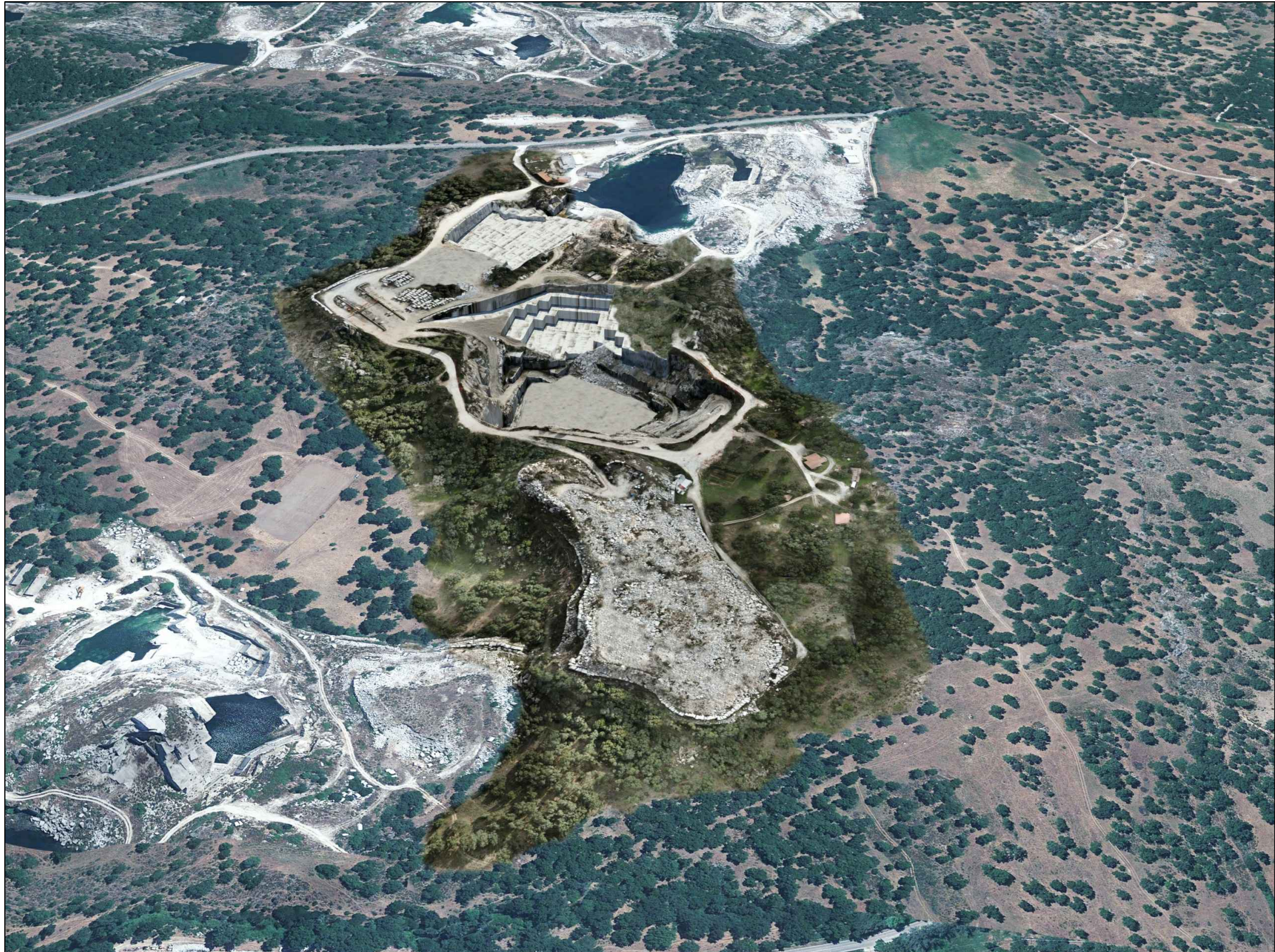
PUNTO DI VISTA VIRTUALE 2 - SITUAZIONE ALLO STATO FINALE -