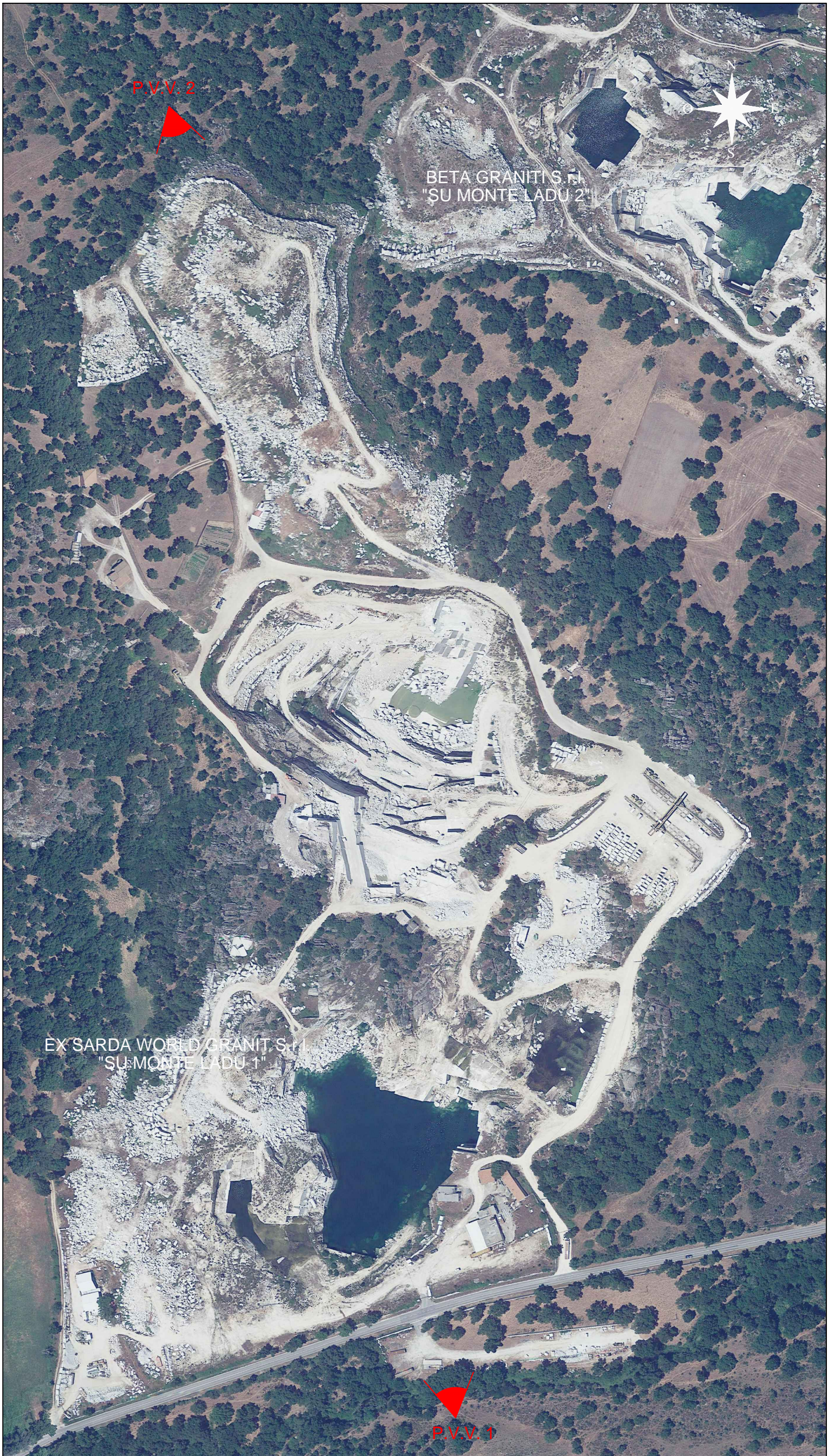
INDIVIDUAZIONE DEI PUNTI DI VISTA SU IMMAGINE SATELLITARE