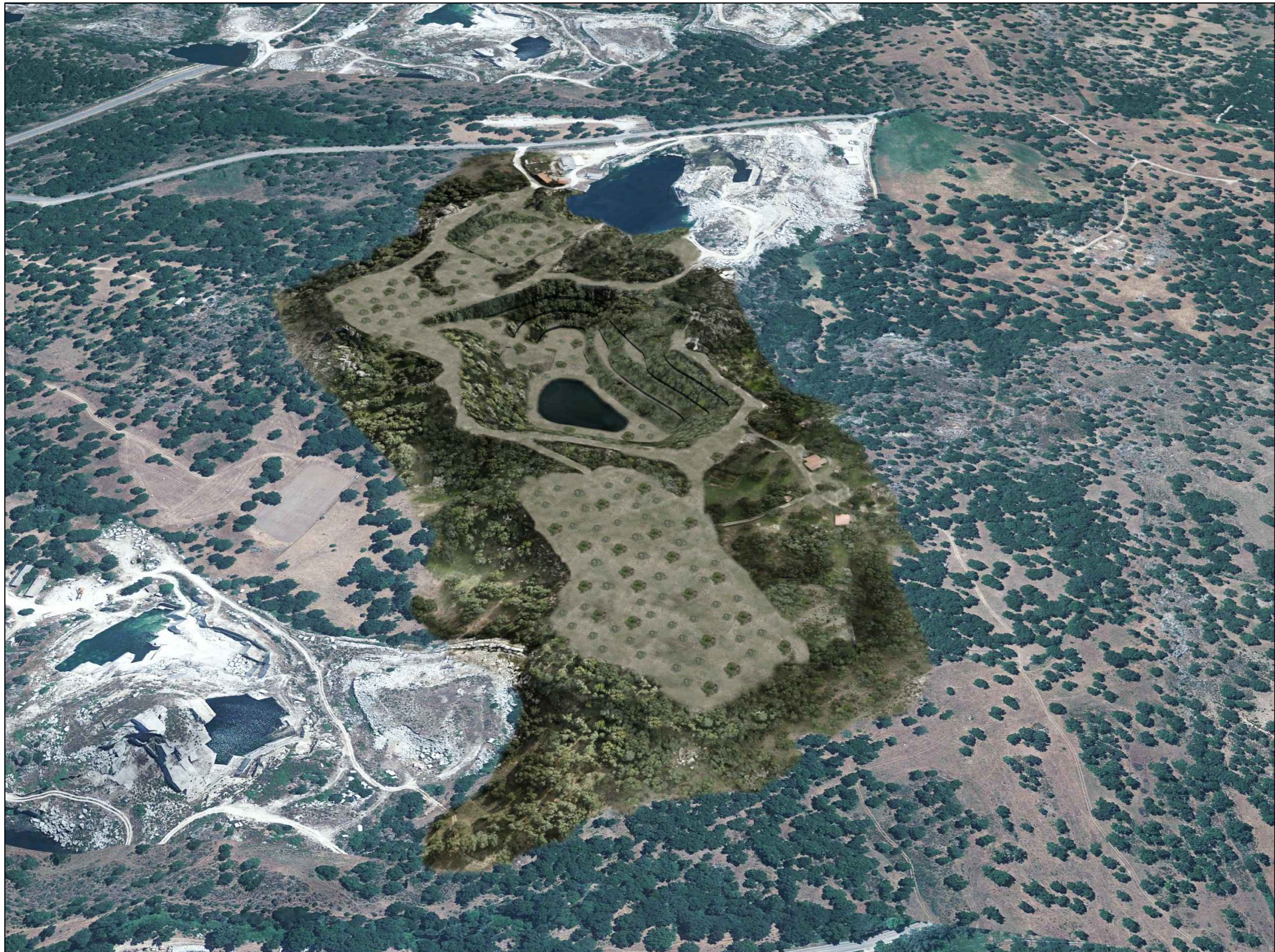
PUNTO DI VISTA VIRTUALE 2 - SITUAZIONE A RIPRISTINO AVVENUTO -