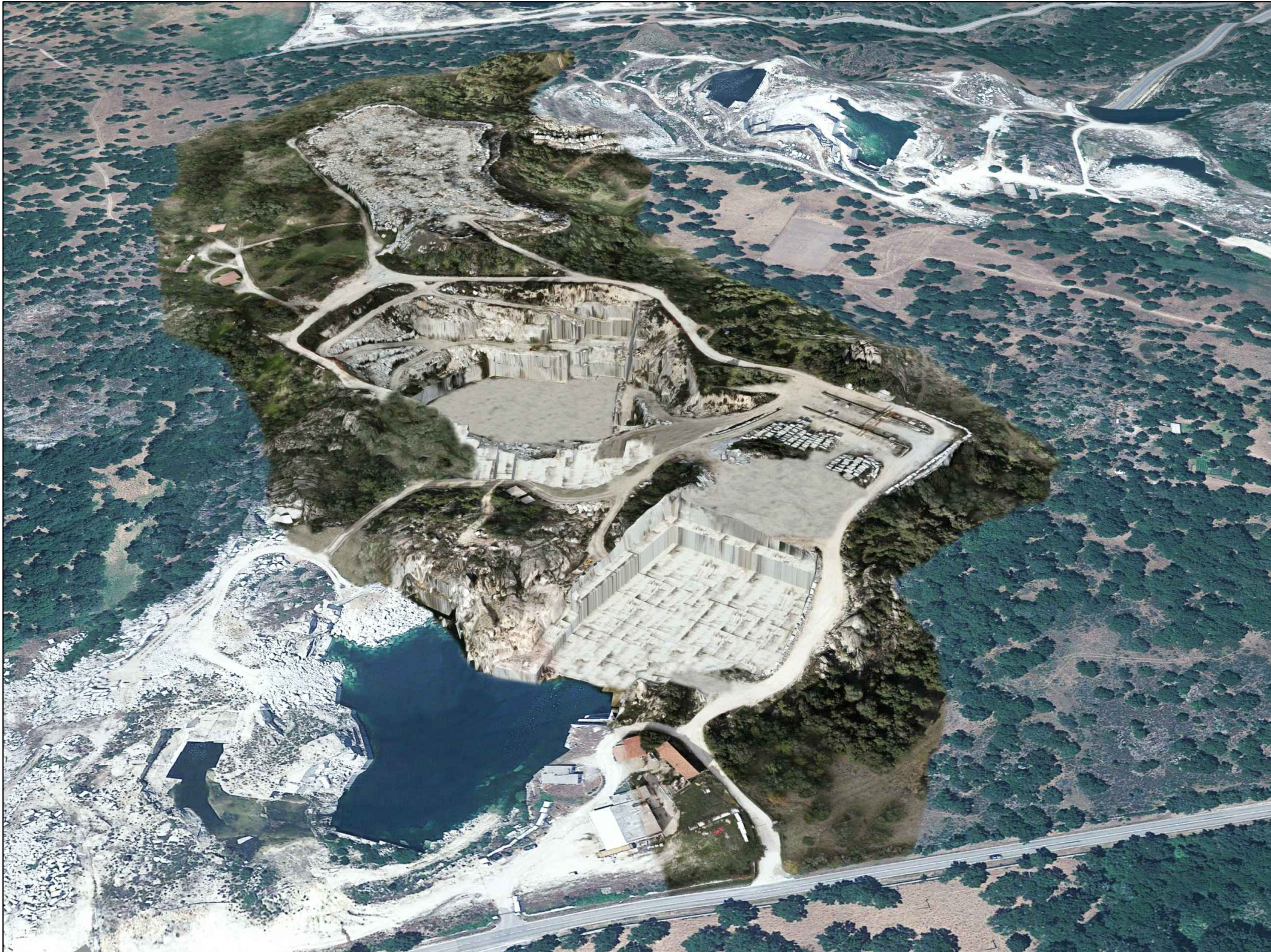
PUNTO DI VISTA VIRTUALE 1 - SITUAZIONE ALLO STATO FINALE -