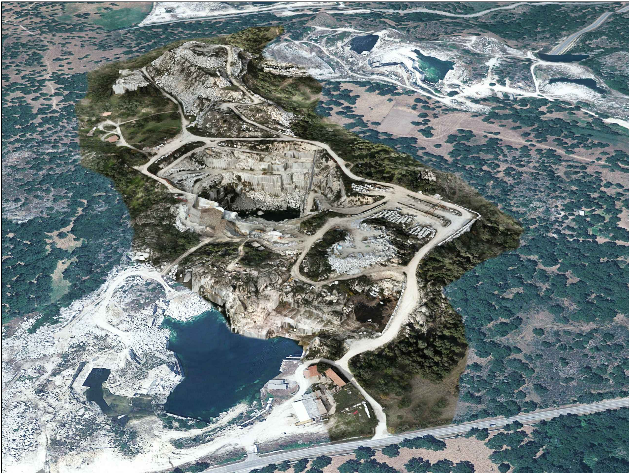
PUNTO DI VISTA VIRTUALE 1 - SITUAZIONE ALLO STATO ATTUALE -