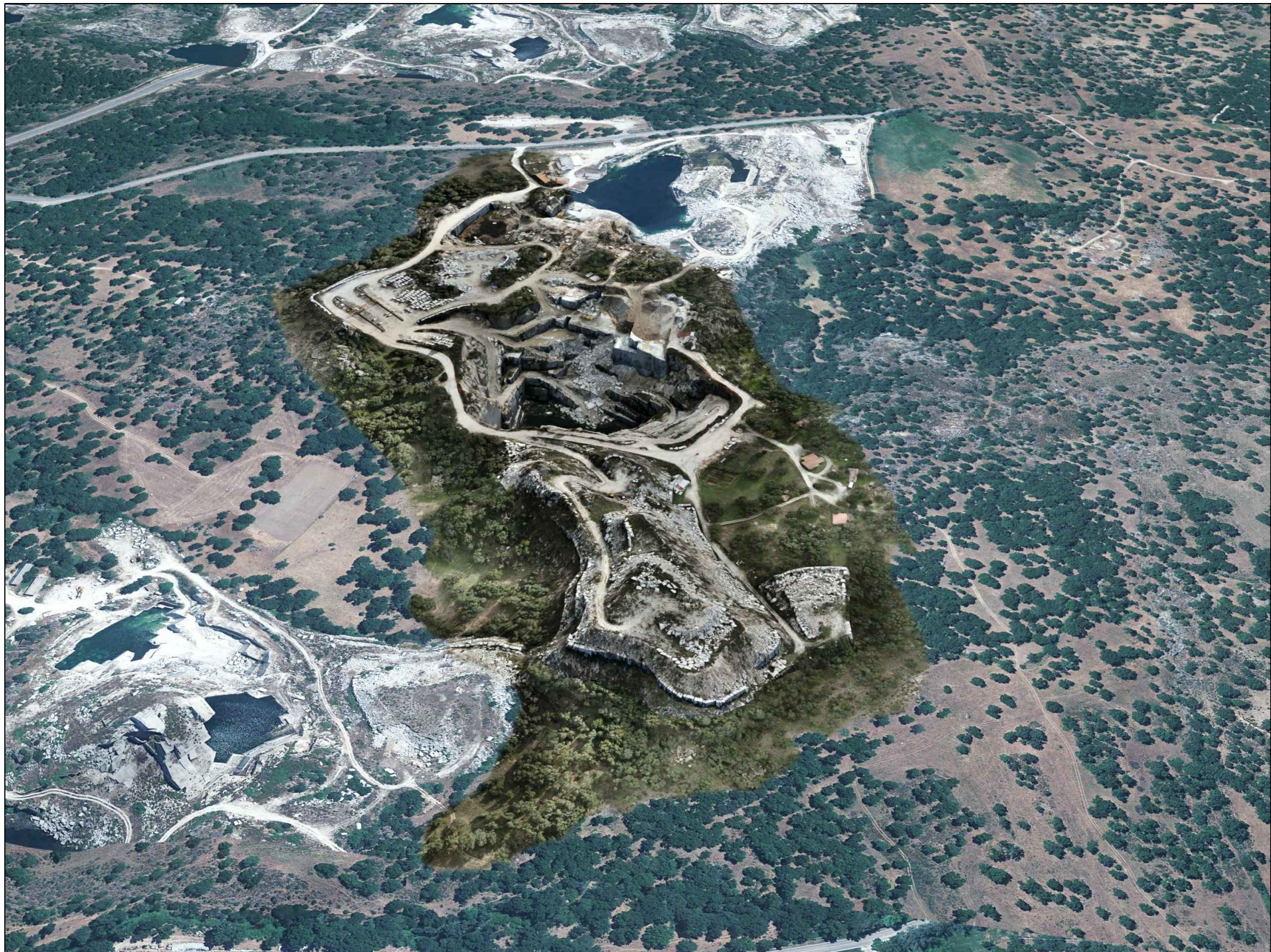
PUNTO DI VISTA VIRTUALE 2 - SITUAZIONE ALLO STATO ATTUALE -