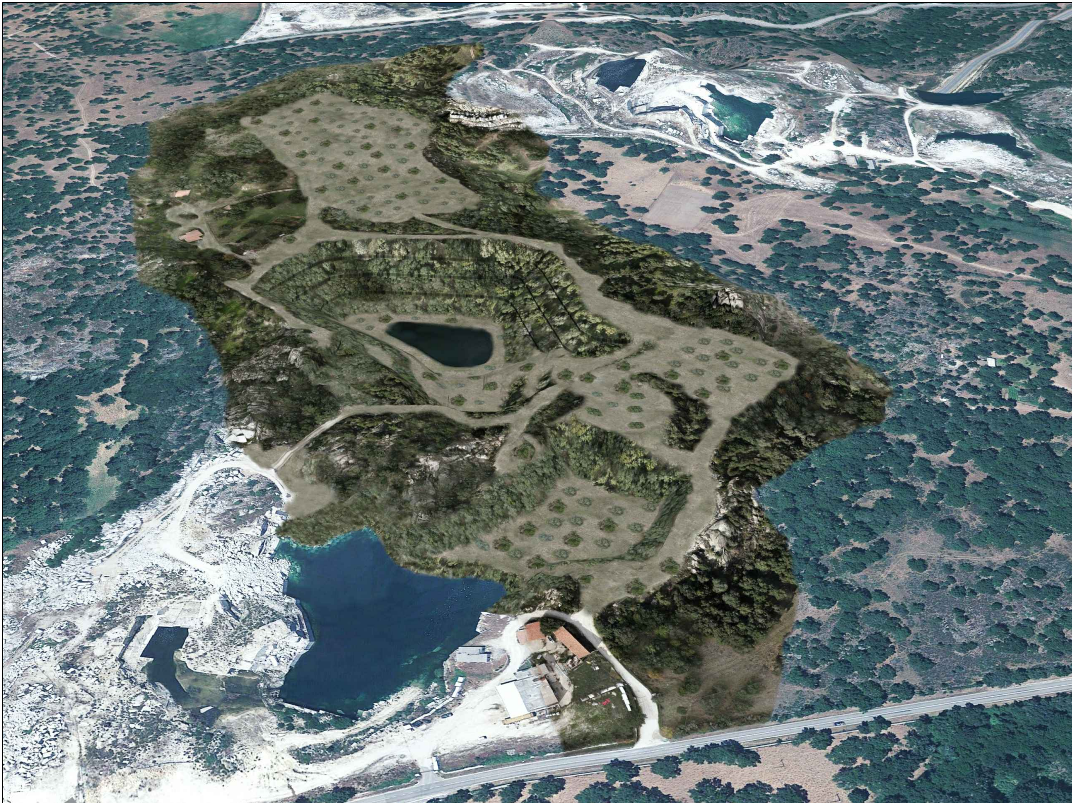
PUNTO DI VISTA VIRTUALE 1 - SITUAZIONE A RIPRISTINO AVVENUTO -